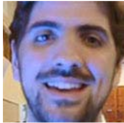
Santiago Soto, Director del Instituto Nacional de Juventud de Uruguay