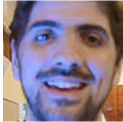
Santiago Soto, Director del Instituto Nacional de Juventud de Uruguay